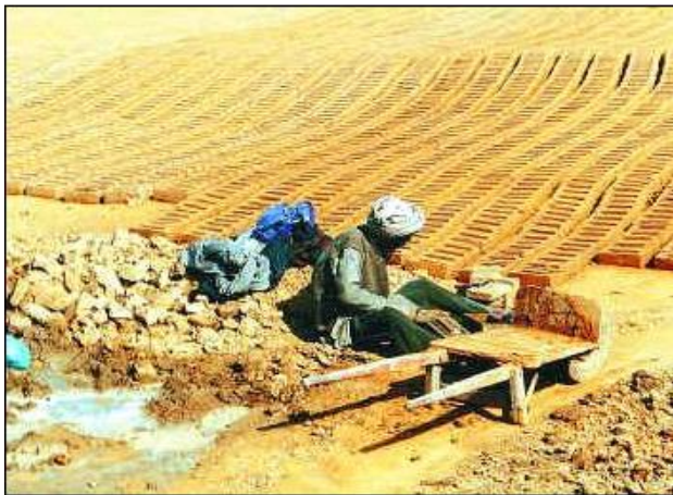
Figure 2.3: Aged worker.