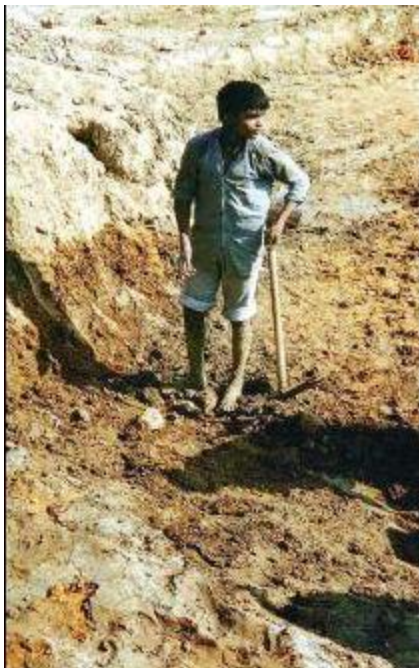
Figure 2.5: Young worker.