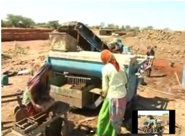
Figure 2.1: Brick making machine.