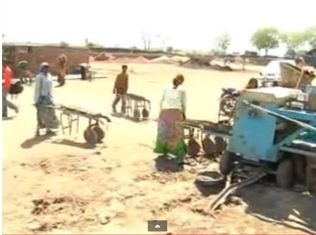
Figure 2.2: Kid and women worker.