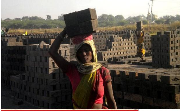
Figure 2.4: Woman worker.